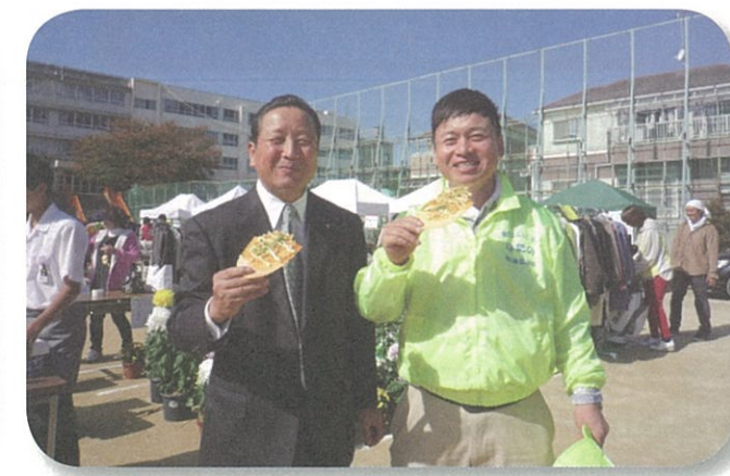
渋中の「たこせん」おいしいよ!