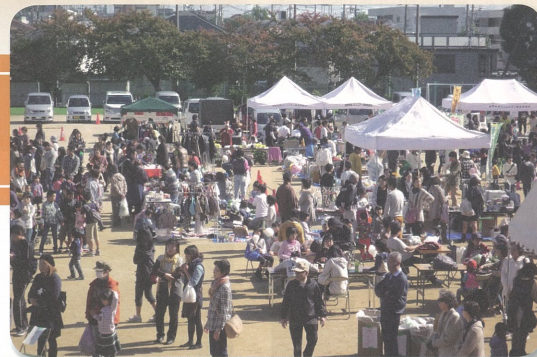
あおぞらdeはたのフェスタ(11月3日)