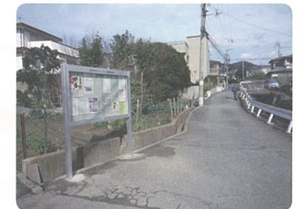
▲自由が丘(共同利用)