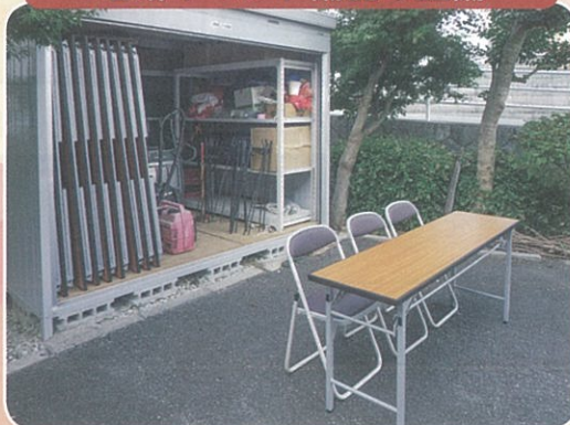
地域イベント備品の整備