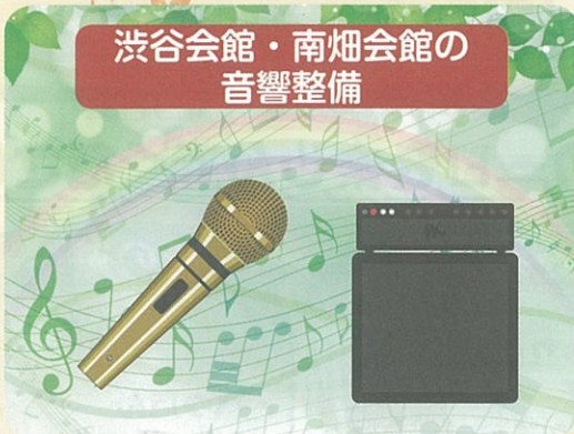
渋谷会館・南畑会館の 音響整備