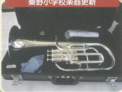
秦野小学校楽器更新