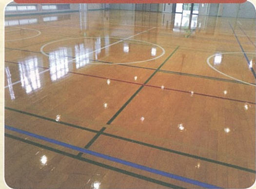
秦野小学校体育館床の塗装