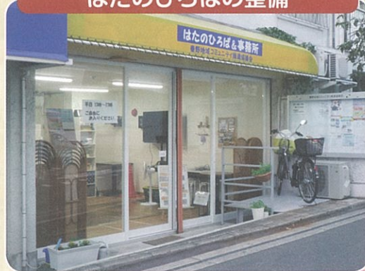
はたのひろばの整備