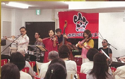
5月18日(土)：アブサント・アンサンブル／弦楽器とフルートなどによる7人編成の音楽コンサート。

素敵な音楽が鑑賞できたり、プロの落語が生で聴けたり、30回目を迎えた「ふしおだい山びこフェスタ」の会場は、いつも満員の盛況です。(※上半期は3回開催。)