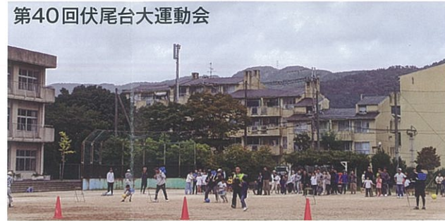
◎高齢者の居場所づくり意見会: コミプラにて随時開催

60歳以上の方を対象に、夕食をとりながら交流を深めていただき、これからのまちづくりや居場所づくりについてご意見を聞かせていただいた会合です。(※今後の予定は掲示板などの案内をご覧ください。)