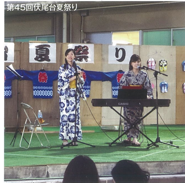
◎第45回伏尾台夏祭り: 8月24日(土)開催

「コミュニティ推進協議会」が支援しました上半期の主な活動のご報告です。地域の活性化に対する各グループの地道な活動と、ご参加していただいた住民の皆さまに感謝いたします。