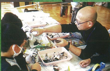
科学実験アラカルト

改修工事を終えた小学校（南校舎）の跡地活用の実験として、1～3月に「創生会議」が企画開催した「土曜祭」の様です。車のお絵描き、モデル作り、フリマ、音楽ライブなど親子で楽しめるさまざまなイベントを土曜日に開催。カフェの利用者も多く、「まいど楽しい」にぎわいを見せました。