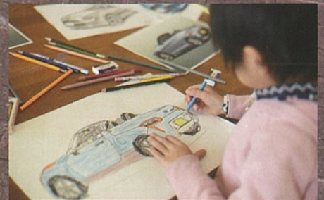
カーデザイナーと一緒に絵描きとモデル作り