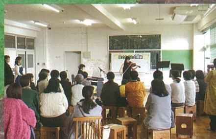
ファミリーコンサート