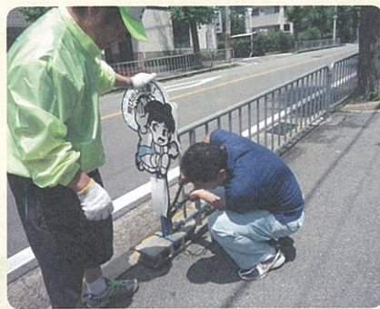
★秦野校区内すべての飛び出し坊やを入替しました