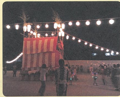
紅白幕が新しくなりました