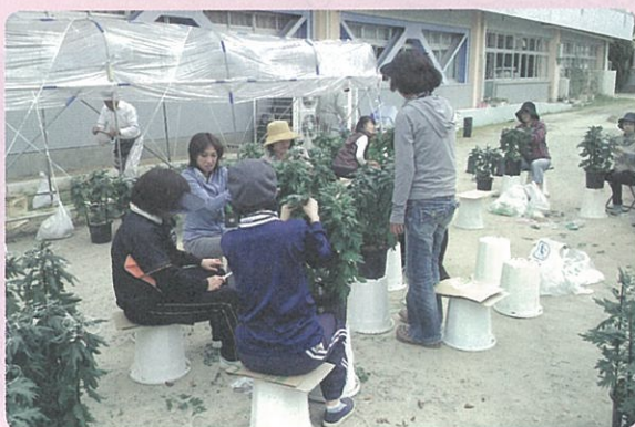
渋谷中学校で育てた菊が見事に咲きました