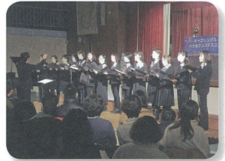
秦野小学校PTAコーラス