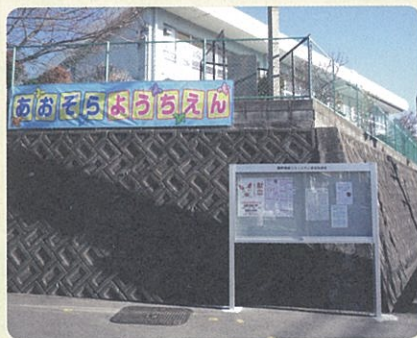
あおぞら幼稚園南西角