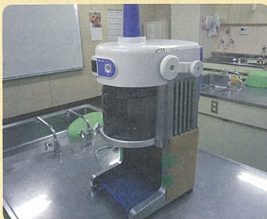
軽くて使いやすいかき氷器を購入しました