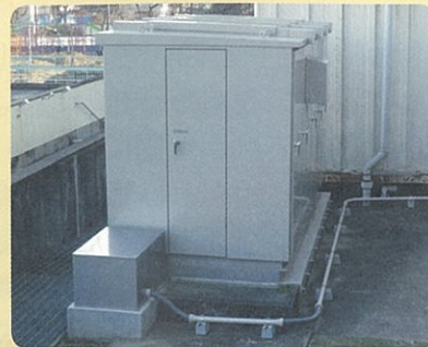
秦野小学校キュービクルの配電盤工事を行いました