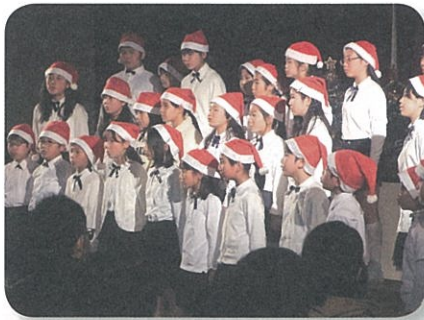
秦野小学校合唱部