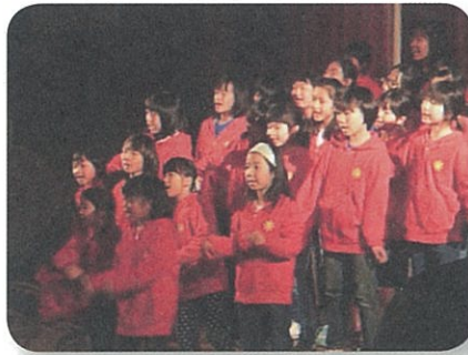
池田ジュニア合唱団