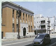
② ビアマールセンター