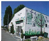
細河みどりの郷案内所