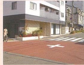
道路安全対策強化事業