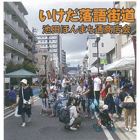
いけだ落語街道 池田ほんまち通商店会