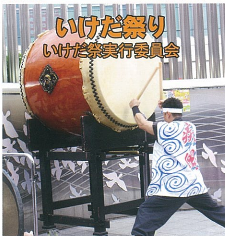
いけだ祭り いけだ祭実行委員会