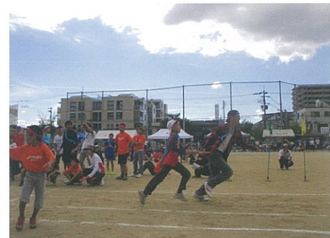
10/ (日) 市民レクリエーション大会