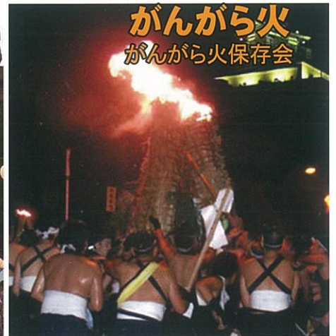
がんがら火 がんがら火保存会