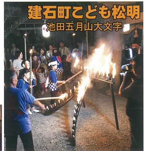
建石町こども松明 池田五月山大文字