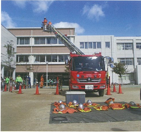
11/18 (日) 池田小学校にて 校区自主防災合同訓練