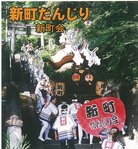
新町だんじり 新町会

古くからの伝統を今に伝える祭り みんなでつくる地域の祭り 活みなぎる池田の祭りです