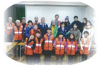
年末恒例「町内会夜警」