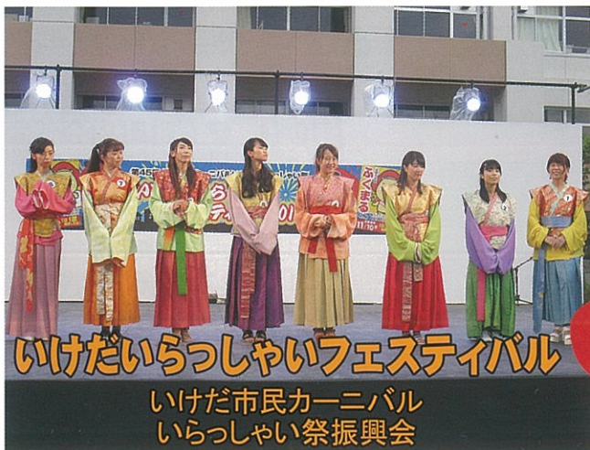
いけだいらっしやいフェスティバル いけだ市民カーニバル いらっしやい祭振興会