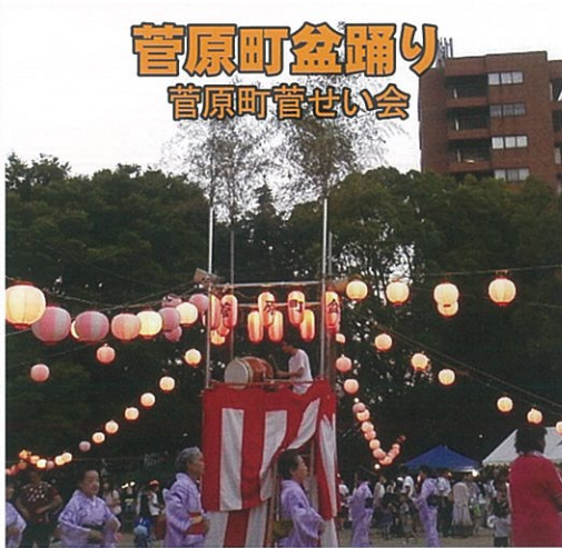
菅原町盆踊り 菅原町菅せい会