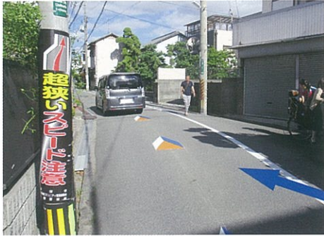
路面“道狭安全標識”設置

イメージハンプとは… 舗装の色や材料を一部分だけ変えて、障害物があるように見せかけたもの スピードの抑止効果を促します