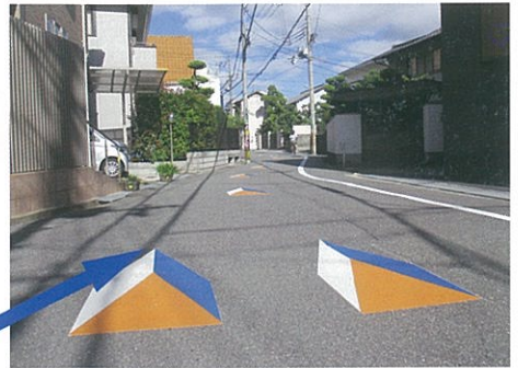
ハローワーク～辻ヶ池公園間市道 (上池田1丁目道路路面)